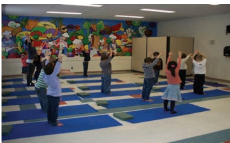
Yoga à l'école Arc-en-ciel