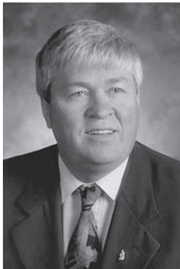
L'hon. Dale Graham

Il a été réélu le 7 juin 1999 et assermenté le 21 juin 1999 en tant que ministre de l'Approvisionnement et des Services. Il est aussi le vice-premier ministre de la province.