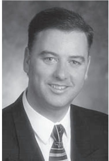
L'hon. Paul Robichaud

Il participe depuis 1985 à la politique provinciale et fédérale et a été élu pour la première fois le 7 juin 1999, dans la circonscription de Lamèque-Shippagan-Miscou.