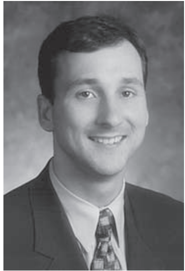
L'hon. Bernard Lord