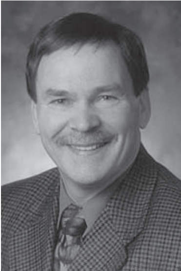
L'hon. Jeannot Volpé

Jeannot Volpé est né le 28 juin 1950 à Saint-Jacques, au Nouveau-Brunswick. Diplômé de l'école publique d'Edmundston en 1969, il a poursuivi ses études à l'Université de Moncton, où il a obtenu en 1973 un baccalauréat en éducation physique.