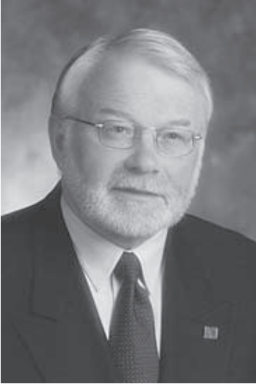
L'hon. Peter Mesheau

Peter Mesheau , député de la circonscription de Tantramar, a été assermenté le 21 juin 1999 comme ministre du Développement économique, du Tourisme et de la Culture. En avril 2000, il a été nommé ministre des Investissements et des Exportations. Il est aussi ministre responsable de Services Nouveau-Brunswick.