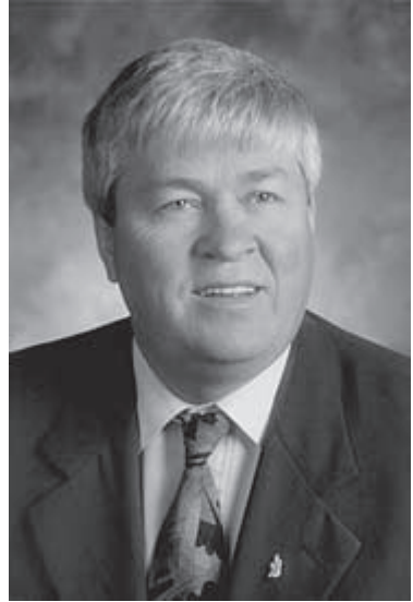
L'hon. Dale Graham

Il a été réélu le 7 juin 1999 et assermenté le 21 juin 1999 en tant que ministre de l'Approvisionnement et des Services. Il est aussi le vice-premier ministre de la province.