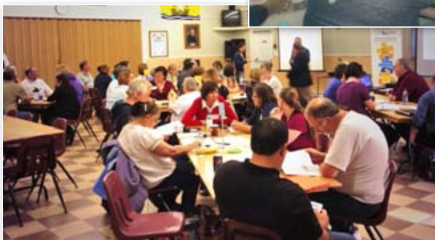
Dialogue public Miramichi, le 17 septembre 2013