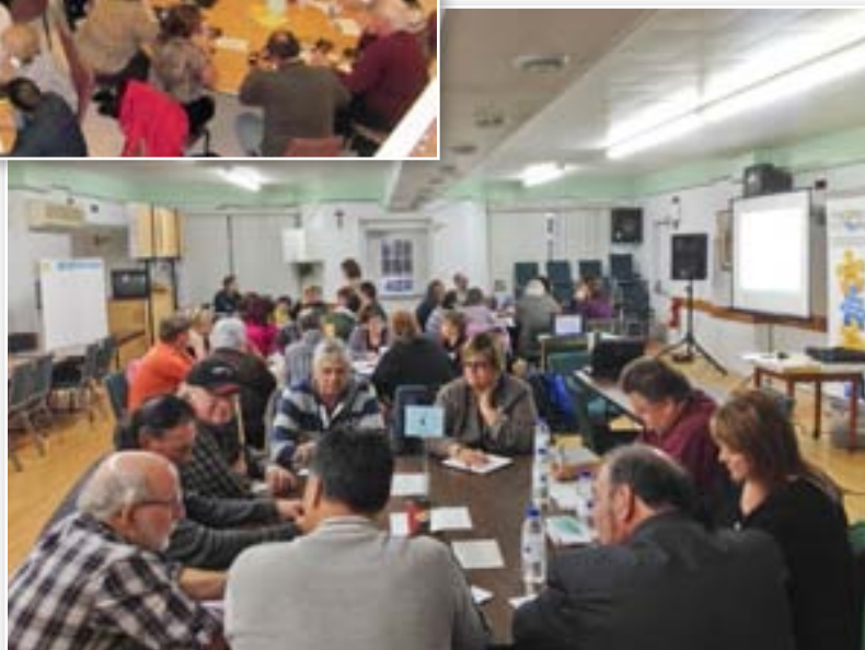
Dialogue public Saint-Léonard, le 23 sept. 2013