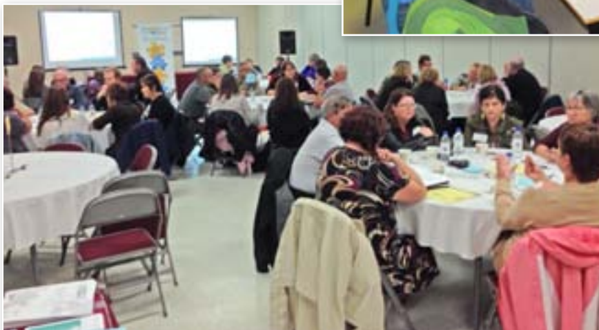
Dialogue public Bathurst, le 25 septembre 2013