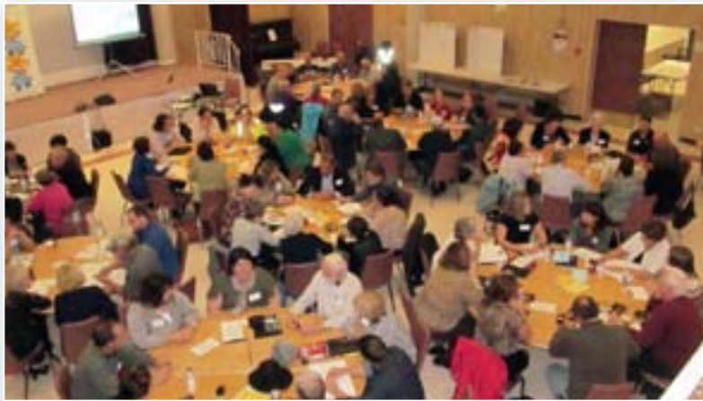
Dialogue public Moncton, le 2 octobre 2013

Que pouvez-vous faire, comme citoyen et/ou comme organisation, pour réduire la pauvreté et contribuer à l'inclusion économique et sociale?