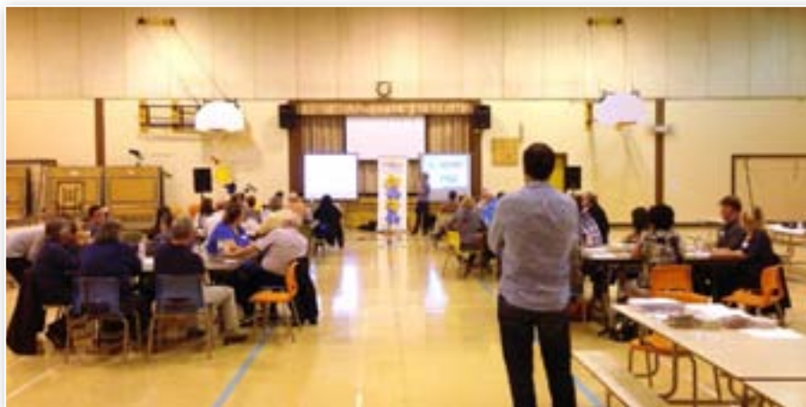
Dialogue public Pokemouche, le 18 septembre 2013

Conformément aux exigences de la Loi, la SIÉS doit soumettre un rapport annuel et, à tous les deux ans, un rapport d'étape qui fait état des progrès accomplis dans la mise en œuvre du Plan.